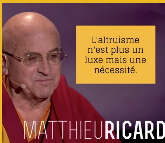
Matthieu Ricard (TEDx Paris 2013)