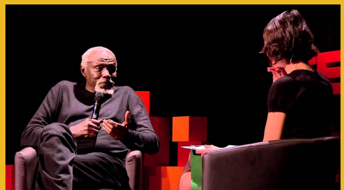
Ousmane Sow et les hommes debout (TEDx 2012)