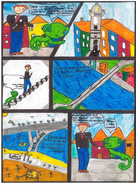
La BD s'invite au LFIP : voir en pages 2 et 3