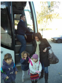
Chegada dos alunos acompan-