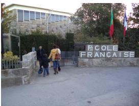
Entrée côté maternelle et administration