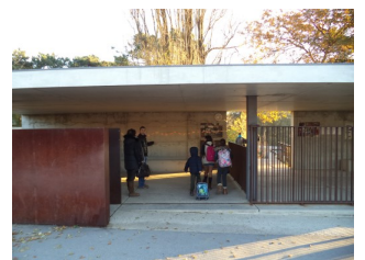
Entrada da primária, colégio e liceu