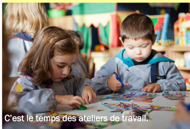
C'est le temps des ateliers de travail.