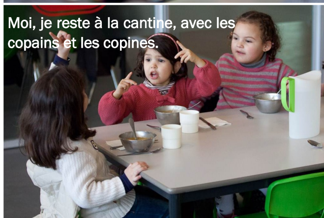
Moi, je reste à la cantine, avec les copains et les copines.

A 11h30, si je reste à la cantine, les adultes responsables m'accompagnent. Sinon, un adulte vient me chercher pour manger à la maison. Après manger, je reviens à l'école. Si je suis en petite section, je me repose. Je peux prendre mon doudou. Je suis surveillé par des adultes.