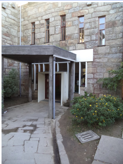
Entrada administrativa do lado do acolhimento aos alunos.

Lycée Français International de Porto 27 rua Gil Eanes | 4150-348 Porto | Portugal | Tél : +351 226 153 030 | Fax : +351 226 153 039 www.lyceefrancaisdeporto.pt