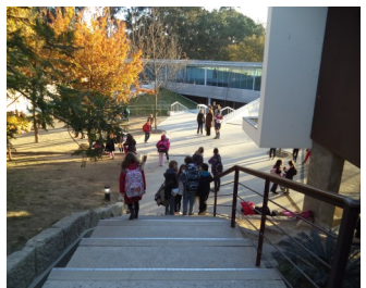
Entrée Primaire, Collège et Lycée