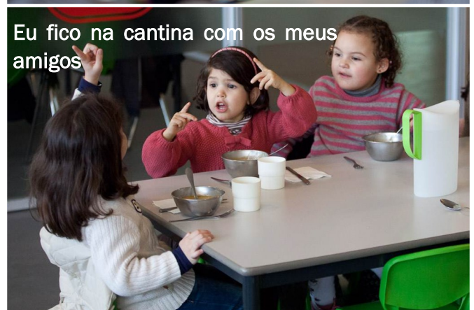
Eu fico na cantina com os meus amigos

Se almoço na cantina, os adultos responsáveis acompanham-me até lá às 11h30. Caso contrário, um adulto vem buscar-me para almoçar em casa. Depois de comer, regresso à escola. Se estiver nos 3 anos, descanso um pouco depois de almoço, e posso trazer o meu peluche. Sou vigiado por adultos.