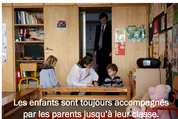
Les enfants sont toujours accompagnés par les parents jusqu'à leur classe.

Je dois mettre mon étiquette pour dire que je suis dans la classe. Puis, nous nous regroupons tous, pour nous saluer, nous parler, chanter, savoir ce que nous allons faire dans la journée. Ensuite, c'est le temps des ateliers de travail, du sport ou d'autres activités. Quand j'ai envie d'aller aux toilettes, je le dis à la maîtresse ou à l'aide maternelle et j'y vais, accompagné.