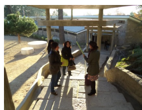
Passage entre pavillon B et C