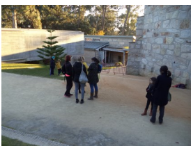
Em direção às turmas do pré-escolar