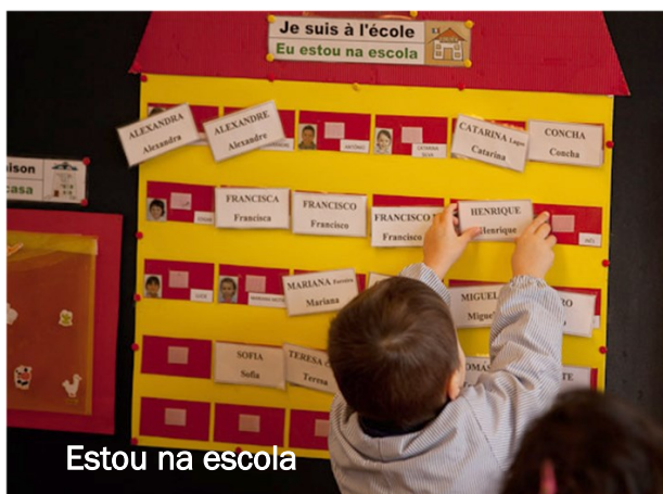
Estou na escola

Se almoço na cantina, os adultos responsáveis acompanham-me até lá às 11h30. Caso contrário, um adulto vem buscar-me para almoçar em casa. Depois de comer, regresso à escola. Se estiver nos 3 anos, descanso um pouco depois de almoço, e posso trazer o meu peluche. Sou vigiado por adultos.