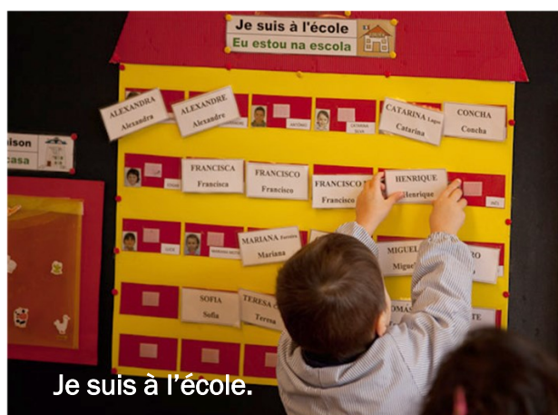
Je suis à l'école.