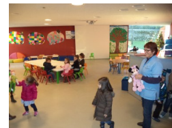
Le pavillon d'accueil