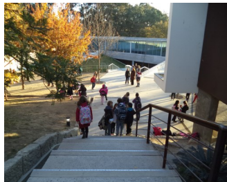
Entrada da Primária, Colégio e Liceu