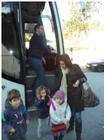
Arrivée des élèves accompa-