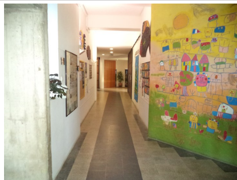
A entrada e a equipa da secretaria.

Este perdem-se facilmente na escola. É indispensável colocar o nome do aluno em todo o vestuário. Os professores recolhem, regularmente, os casacos encontrados na escola e os alunos podem, facilmente, recuperá-los (na maioria das vezes).