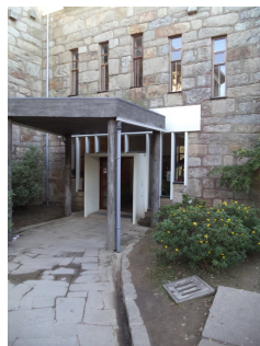
Entrada do edifício administrativo