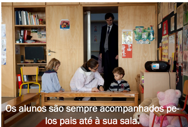
Os alunos são sempre acompanhados pelos pais até à sua sala.

Devo colocar a etiqueta com o meu nome para assinalar a minha presença na sala. Depois, agrupamo-nos todos para nos cumprimentarmos, falarmos uns com os outros, cantar, saber o que vamos fazer durante o dia. A seguir, é o momento dos grupos de trabalho dirigido, da motricidade e de outras atividades. Quando preciso de ir à casa de banho, digo-o à educadora ou à auxiliar e vou acompanhado(a).