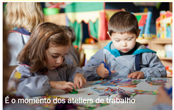
É o momento dos ateliers de trabalho