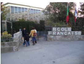
Entrada do pré-escolar e administração