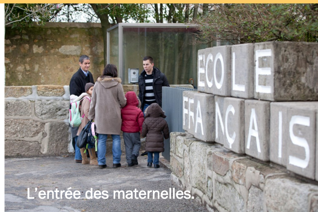
L'entrée des maternelles.

En arrivant, j'enlève mon manteau. Dès que je peux, je le fais seul(e). Je dis « au revoir » à la personne qui m'accompagnait et je rentre en classe. Je peux dessiner, regarder des livres, faire des puzzles, jouer ou discuter avec mes copains, mes copines, l'aide maternelle ou la maîtresse.