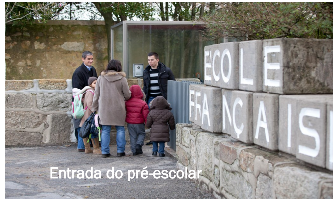
Entrada do pré-escolar

Quando chego, tiro o meu casaco. Assim que puder, faço-o sozinho(a). Digo “adeus” à pessoa que me trouxe e entro na sala. Posso desenhar, ver livros, fazer puzzles, brincar ou falar com os meus amigos, a auxiliar ou a educadora.